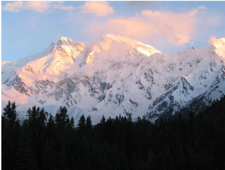
Nanga Parbat